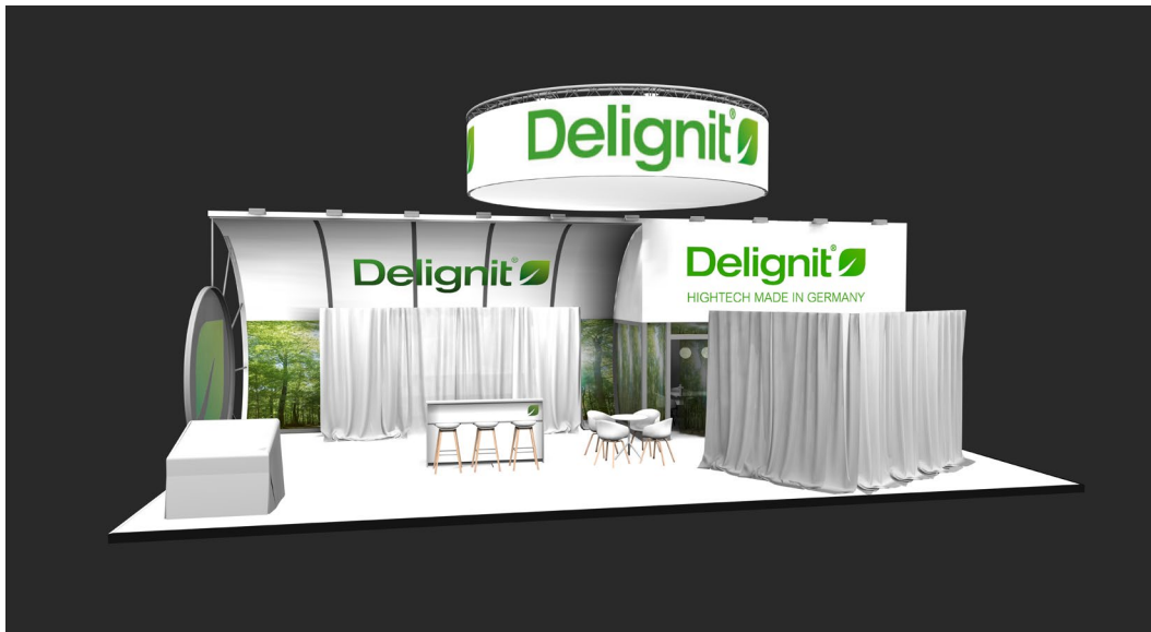
Abbildung 2 Messestand-Visualisierung