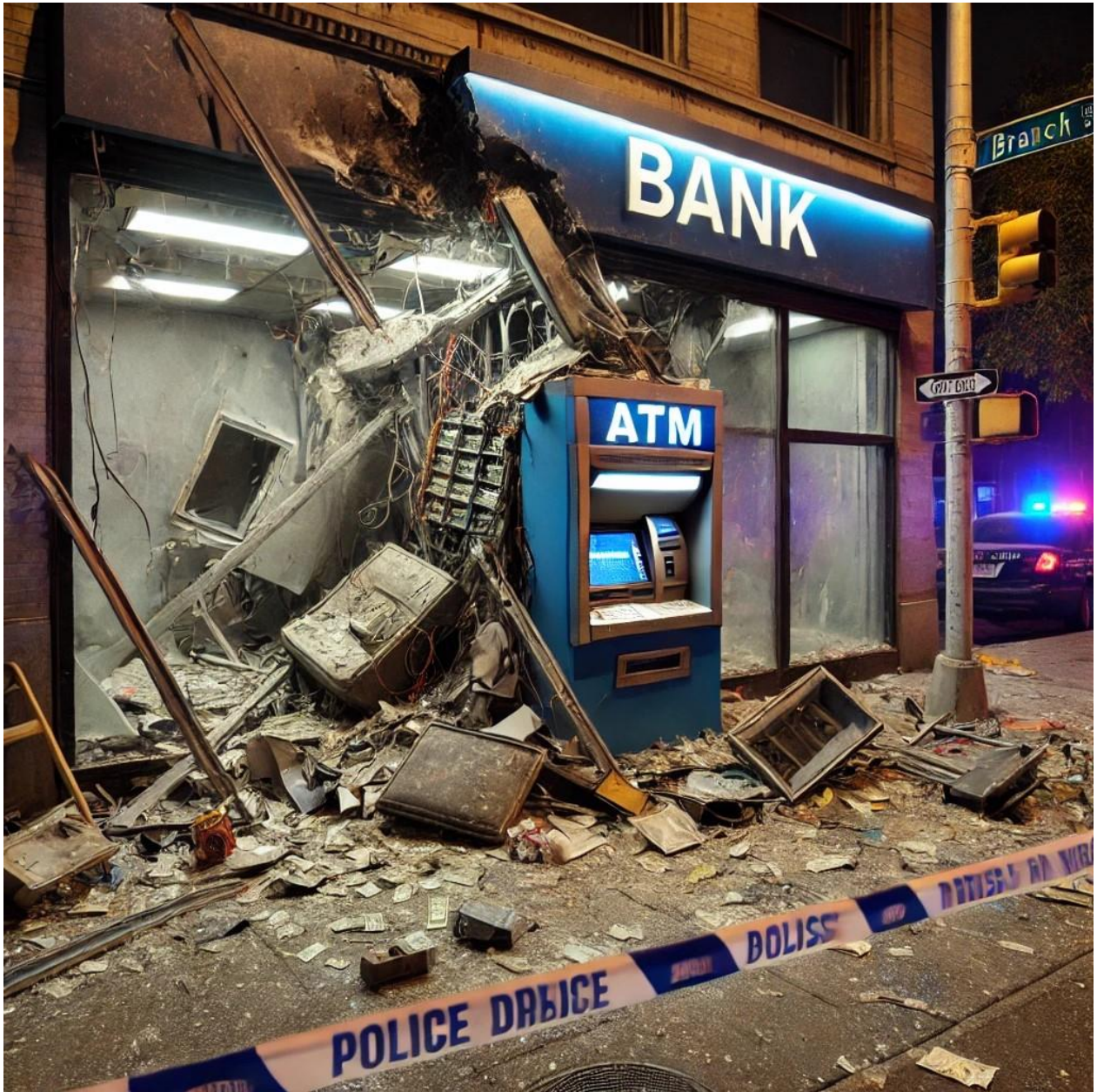
Abbildung 1: „Panzerholz ® Protect“ für Einsatzzwecke Banken Renovierung Geldautomat