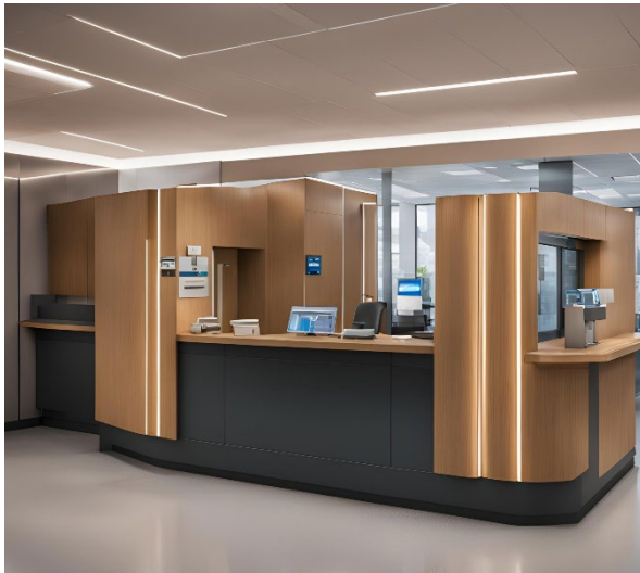
Delignit® Panzerholz® Protect für Schalter in einer Bank