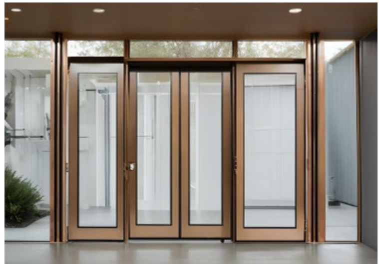
Delignit® Panzerholz® Protect für Türen